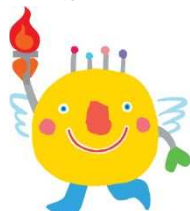
いきいき茨城ゆめ国体 マスコット いばラッキー